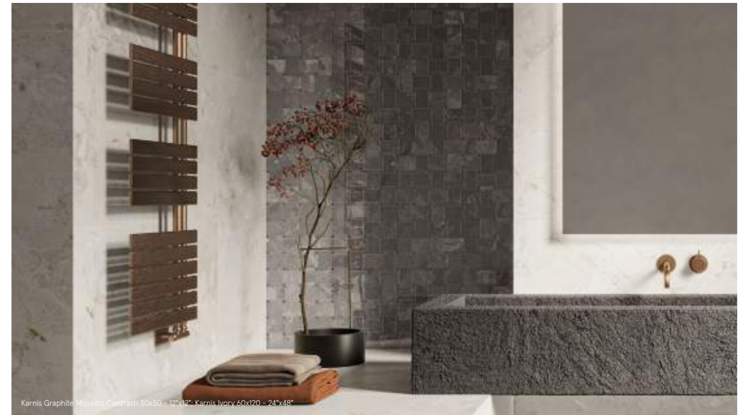
Karnis Graphite Mosaico Contrasti 30x30 - 12"x12" - Karnis Ivory 60x120 - 24"x48"

Per motivi tecnici i pesi sopra indicati possono variare / For technical reasons the weights indicated above may vary.