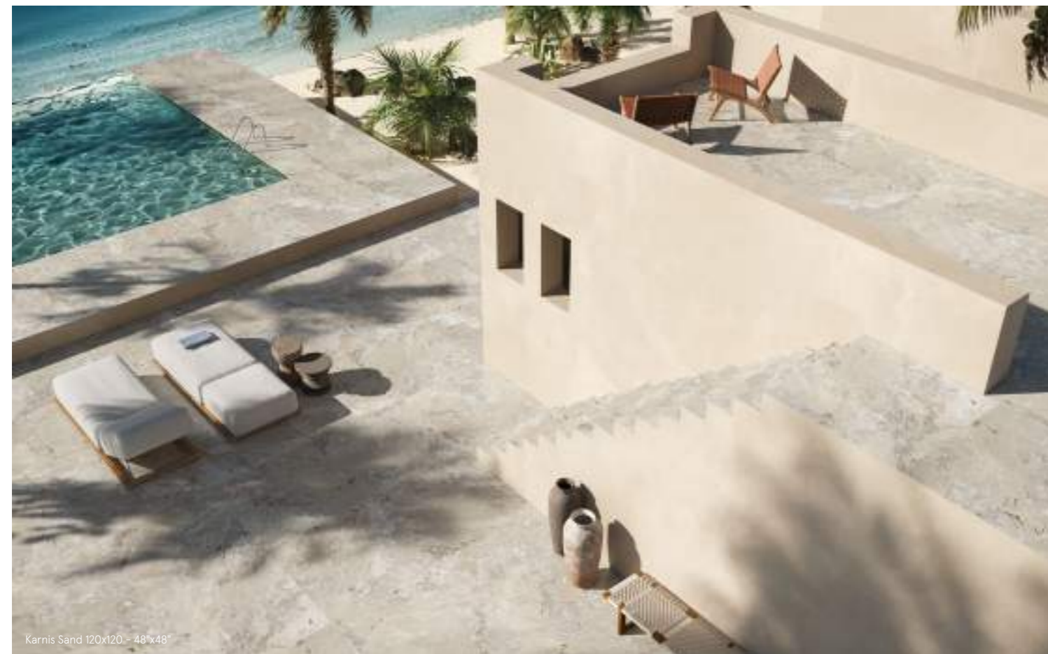
Karnis Sand 120x120 - 48"x48"

Legenda / Legend M metri quadrati/square meters - L metri lineari/linear meters - P pezzi/pieces - S set/set